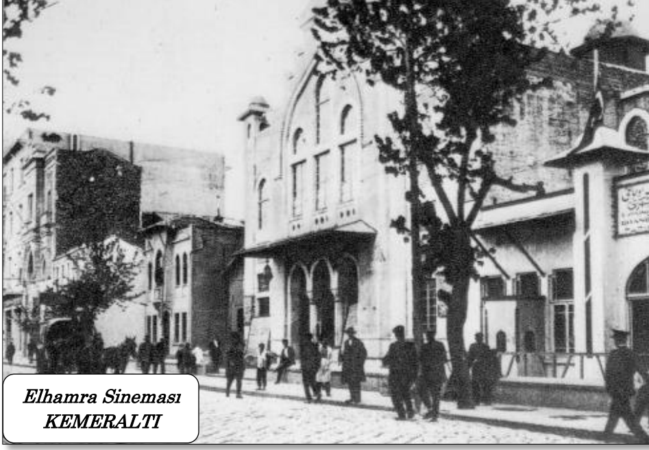
Elhamra Sineması KEMERALTI

Akşamüstü mağazamızı kapattıktan sonra babamla beraber Havra Sokağından, Kemeraltı'ndan yaptığımız akşam alışverişi sonrası evimizin yolunu tutardık. Benim için ayrı bir mutluluktaki bu alışverişler.